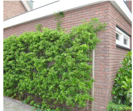
Foto: Vuurdoorn tegen de gevel

Om al die goede ideeën werkelijkheid te laten worden, werden de twee groenste ideeën beloond met een tuincentriumbon.