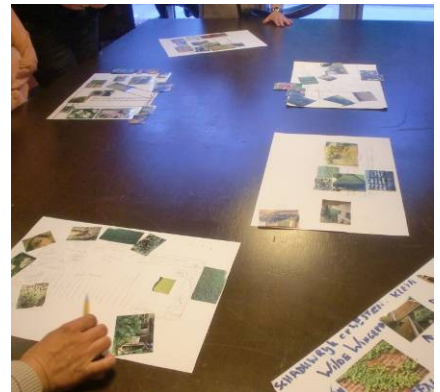
Foto: workshop ideeën voor de tuin